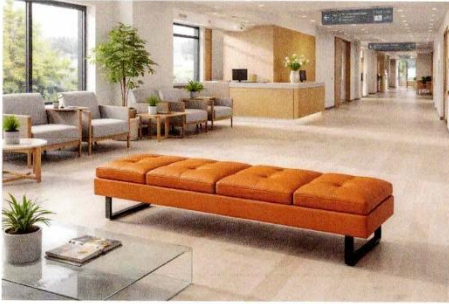
Billede skabt ved hjælp af AI - Hazelnut IC001839

Life læder kan rengøres med: ethanol og klorbaseret desinfektionsmiddel.